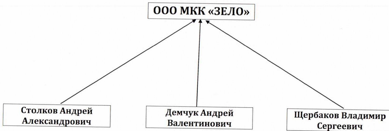
Схема взаимосвязей ООО МКК «ЗЕЛО» и лиц, оказывающих существенное (прямое или косвенное) влияние на решения, принимаемые органами управления ООО МКК «ЗЕЛО»

Генеральный директор ООО МКК «ЗЕЛО» «08» августа 2016г.